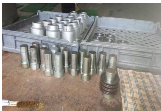
白板山ペアリフト・戸沢ペアリフトB線 さらばね交換