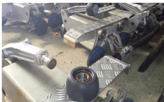
クワットリフト握索機のローラー類点検・交換