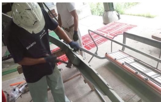
大中平クワッドリフト ジョイントピン交換