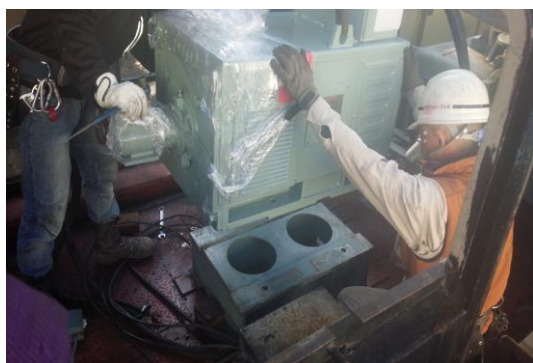
戸沢ペアリフトB線電動機 オーバーホール