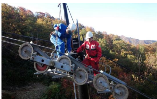
支柱索受けの点検・整備

全リフトのモーター・減速機・原動滑車軸・折返し滑車軸の振動検査 全リフト原動機・支柱の全索受け、点検・グリスアップ 大中平クワッドリフト全搬器 ジョイントピン交換 戸沢ペアリフトB線電動機 オーバーホール 白板山ペアリフト・戸沢ペアリフトB線前搬器 握索部さらばね交換 全クワットリフト握索機のローラー類点検・交換