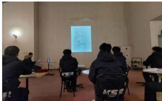
新人安全教育研修風景