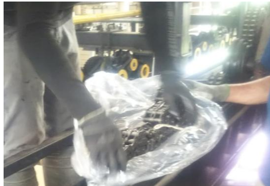
Bリフト 押送駆動移動チェーン交換