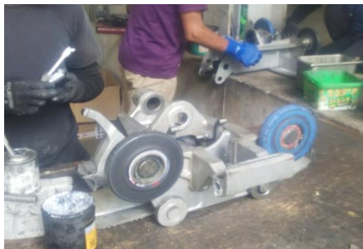
Dリフト 握索機分解整備