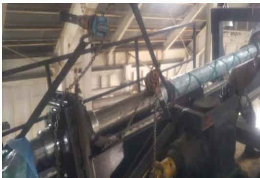
Cリフト 中空軸OH、ストレートギヤボックス交換