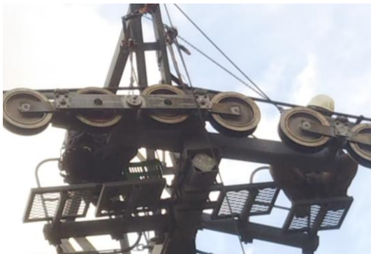
支柱索受け装置の点検整備