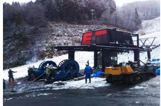
Eリフト 索条の更新