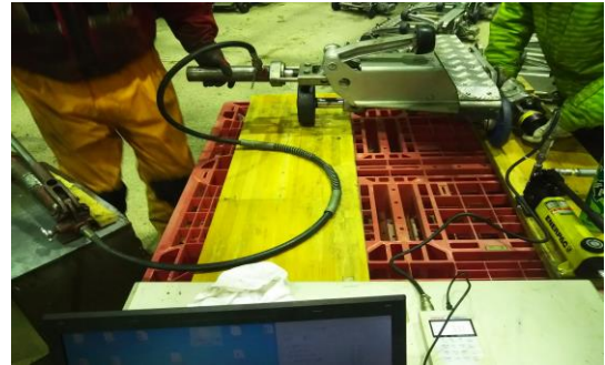
Bリフト 握索機分解整備後の耐滑試験