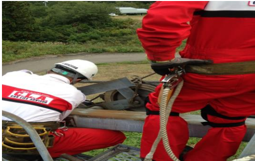
支柱索受けの点検・グリスアップ