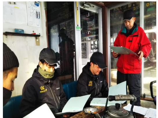
新人安全教育研修風景