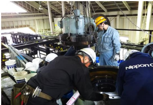
Cリフト 減速機内部検査