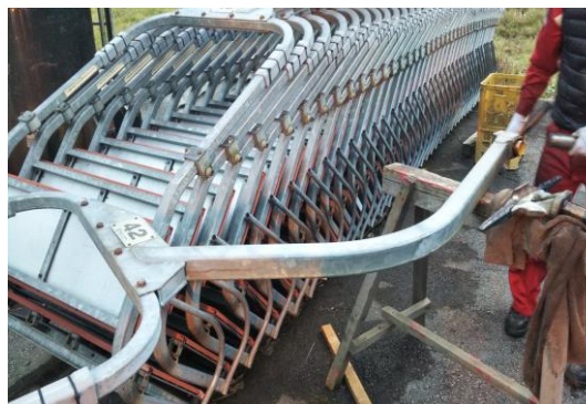
Aリフト 搬器サスペンダーブッシュ交換