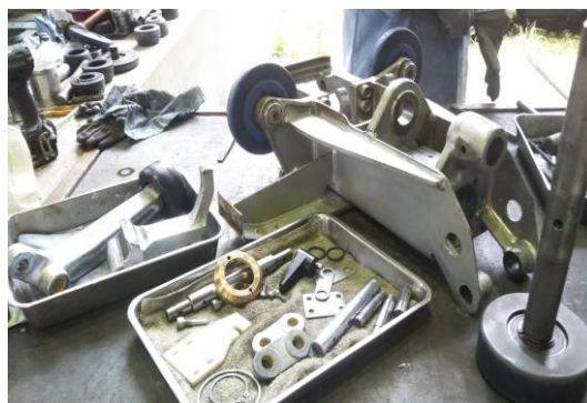
Cリフト 握索機分解整備