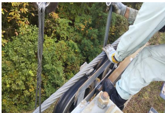
支柱索受けの点検整備