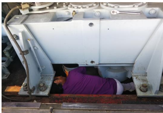
Aリフト 減速機オイル交換