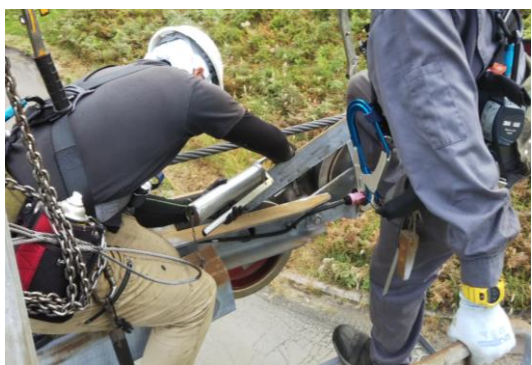
支柱索受けの点検整備