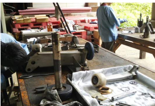
Bリフト 握索機分解整備