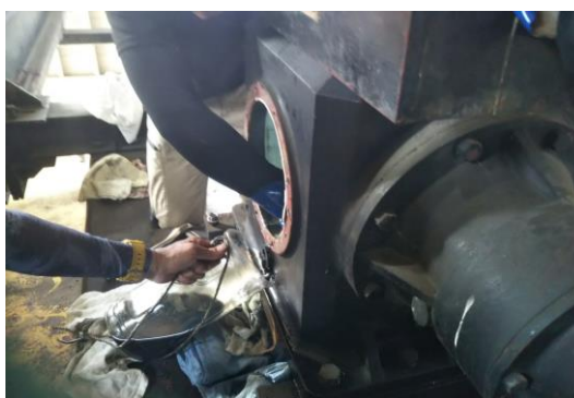
クワッドリフト ギヤボックスオイル交換