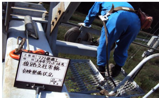
支柱索輪整備状況