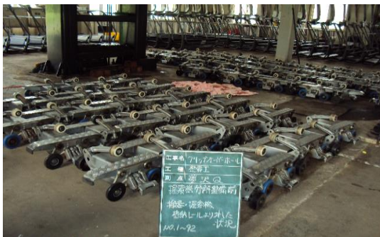
クワッド握索機整備状況

全リフトのモーター・減速機・原動滑車・折返し滑車の振動検査、全リフト減速機オイル交換、全リフト支柱の索輪グリスアップ及び消耗等不具合索輪120枚交換、戸沢ペアリフトB線・C線のワイヤーロープ交換、白板山ペアリフト運転室建替え、4人乗り高速リフト握索機の半数の完全オーバーホール、同握索機のローラーの消耗・不具合品の新品交換等々