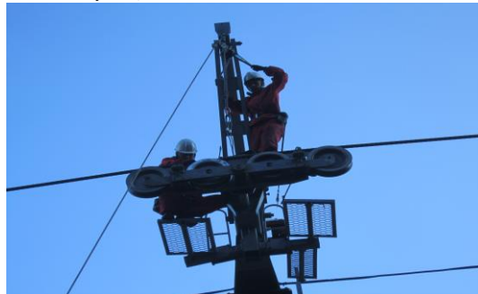
支柱索輪整備状況