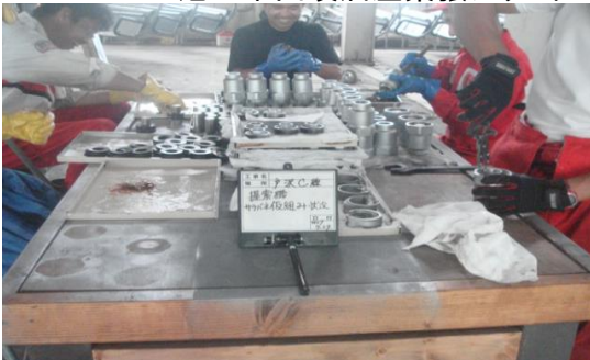
ペアリフト握索機整備状況