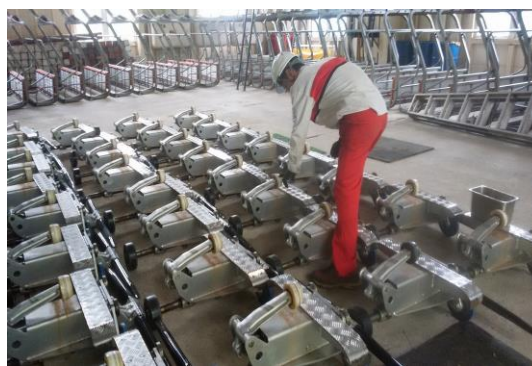
クワットリフト握索機の点検