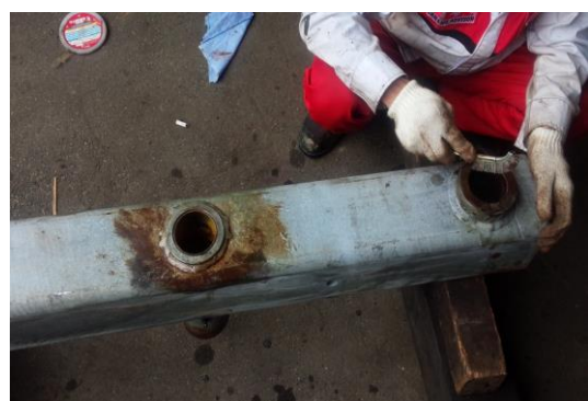
クワッドリフト支柱ビーム、オーバーホール