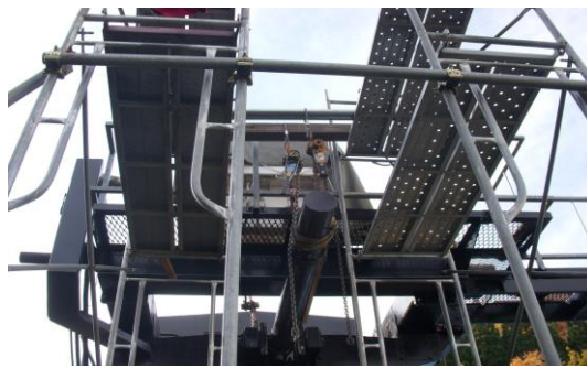
戸沢ペアリフト油圧緊張シリンダーのオーバーホール