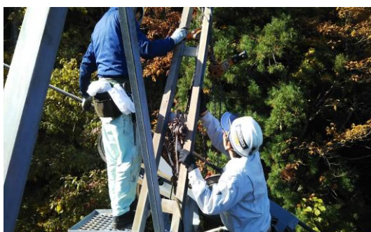
支柱索受けの点検・整備