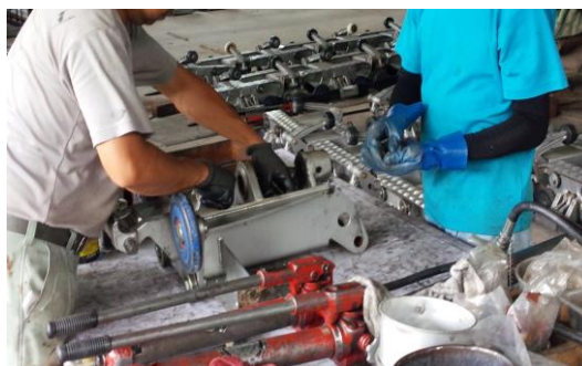
池の平クワッドリフト 握索機分解整備