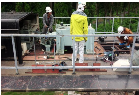
戸沢ペアリフトC線電動機・減速機 オーバーホール