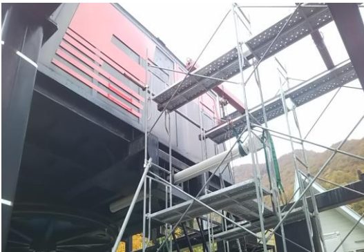
Eリフト 油圧緊張シリンダーの交換