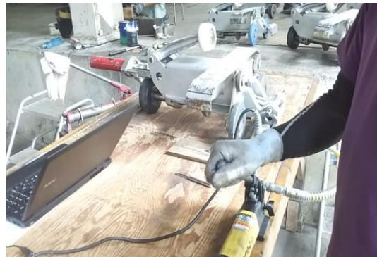
Dリフト 握索機分解整備後の耐滑試験