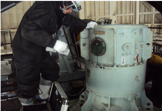
全リフト 振動検査