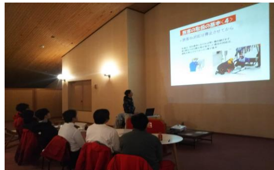
新人安全教育研修風景