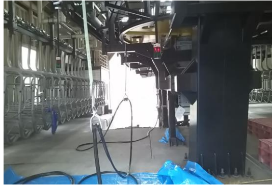
Bリフト 通信ケーブルの更新