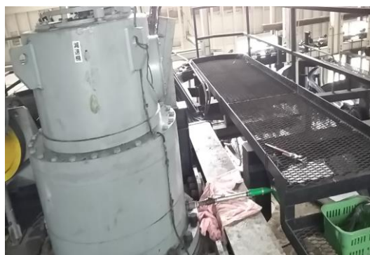
Dリフト 減速機オイル交換