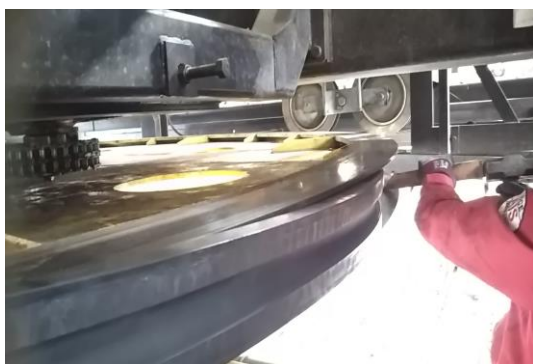
Cリフト 原動滑車ゴムライナー交換