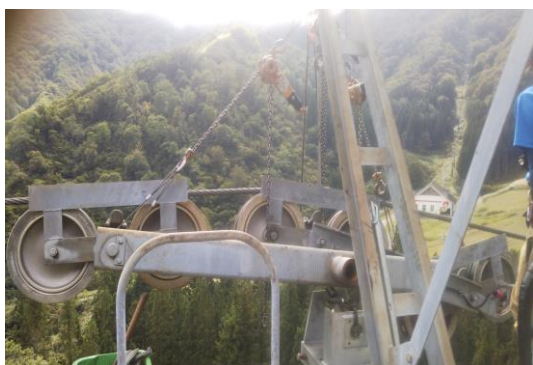
Aリフト 索受ブラケット交換