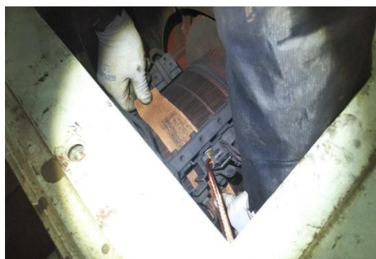
Bリフト モーターブラシ交換