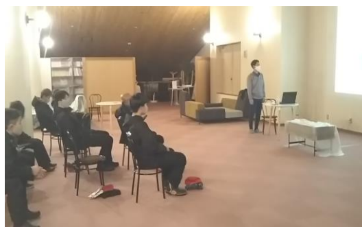
新人安全教育研修風景